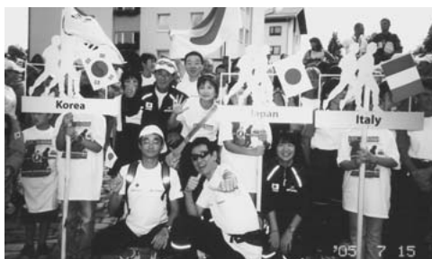
図-1 開会式の入場行進を待つ日本チーム

日本チームの24時間走は、24時間ノンストップで走り続けられる体制を整える。チームエイドでは、飲み物はペットボトルに入れて専任サポーターが手渡し、食べ物も走りながら食べられる容器に入れ手渡し、麺類、おにぎり、カレーライスなど走りながら食べる。