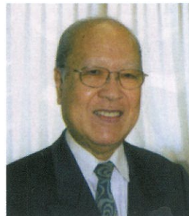
MS 創始者 全国新幼児音楽教育研究会会長

ミュージックステップで育った子どもたちが絶対音感を身に付けるのは当然ですが、音楽的能力だけでなく、実に様々な能力が育っていることに驚かされます。素直さ集中力、けじめのある振る舞い、協調性、社会性、表現力・・・幼児期にこれらの能力をしっかりと身に付けた子どもたちの未来は、明るく頼もしい限りです。幼児期のこの「感じる体験」こそ、「人を作る」と信じてやみません。