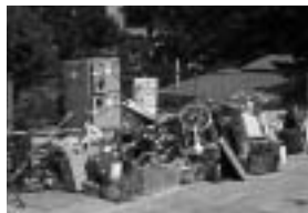
不法にごみが捨てられている置き場

最近、市内各所の資源物置き場への不法投棄が後を絶ちません!このような心無い行為に、多くの方が大変迷惑しています。不法投棄はれっきとした犯罪です。ルールを守って住みよい環境を守りましょう!