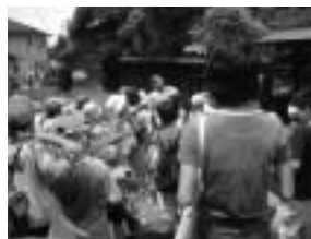
カレッジ講座(8月「夏休み大学宿泊 私たちの瀬戸探検隊」)