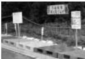
自治会によって管理されている置き場

資源物置き場に『燃えないごみ・粗大ごみ』を置かないでください。『燃えないごみ・粗大ごみ』は予約制による、戸別収集方式で回収を行っています。ただし、以下の場合を除く。