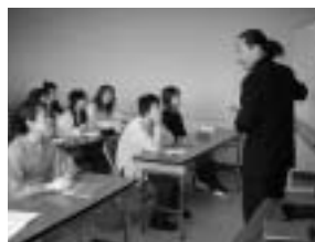
カレッジ講座 (4月「カラーセラピー入門」)

2005年4月からは、「パーティせと」で、本格的に大学コンソーシアムせとエクステンション部会による講座が始まります。みなさんの参加をお待ちしています。